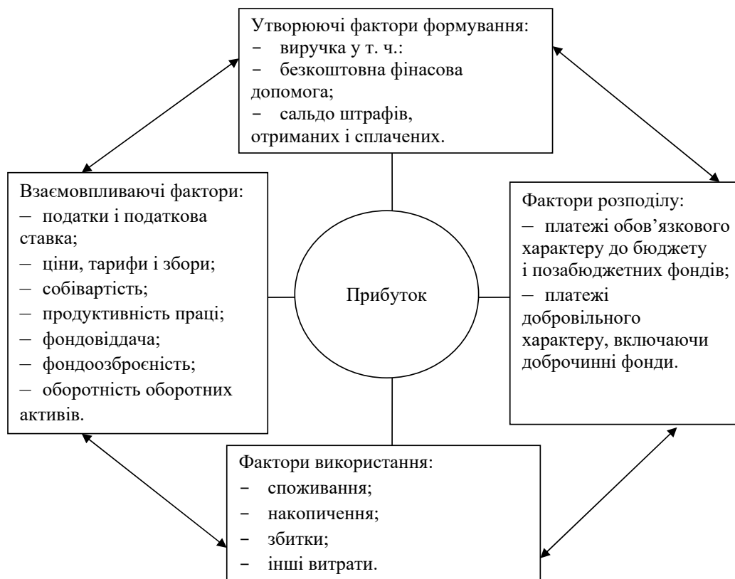
Рис. 1. Основні чинники впливу на величину прибутку підприємства

Проте вони не можуть визначати ступінь ефективності господарювання. За інших однакових умов більш суттєву суму прибутку матиме підприємство, що володітиме більшим капіталом, застосує більше живої та матеріалізованої праці, більше виробляє і продає продукції чи послуг. І. Бланк дає повніше та влучніше визначення прибутку як частини отриманого на залучений капітал чистого доходу підприємства, а це характеризує його отриману винагороду за різноміснні ризики підприємницької діяльності. Для того щоб зробити висновок щодо рівня ефективності функціону-