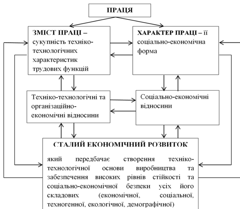
Рис. 1. Абстрактно-логічна схема взаємозв'язків та взаємовпливу між змістом і характером праці та складниками сталого економічного розвитку

підприємств, що впроваджували інновації, у загальній кількості промислових підприємств, то він був більшим і становив у 2020 р. 13,8% [9].