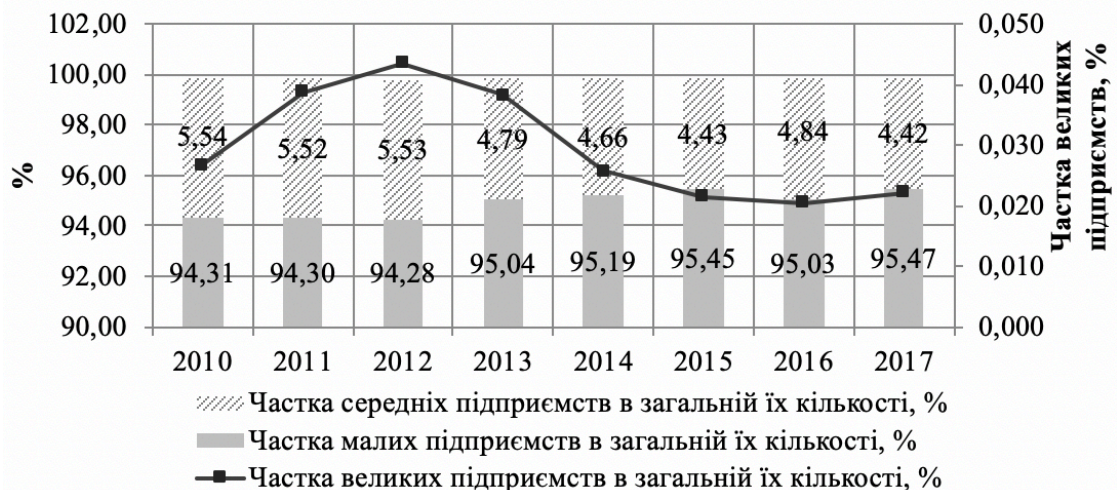
Рис. 3 Зміна структури підприємств України за їх розмірами

Тенденція до зростання частки малого бізнесу в структурі підприємницького сектору України протягом останніх років (незначне зниження на 0,44 % в 2016 році порівняно з попереднім роком) має важливе значення для економіки країни, оскільки саме мале підприємництво є досить гнучким і швидко адаптується до змін зовнішнього середовища, вимог міжнародного поділу праці зокрема, що при вмілому регулюванні та підтримці може стати дієвим інструментом перебудови та розвитку економіки в цілому (рис. 3).