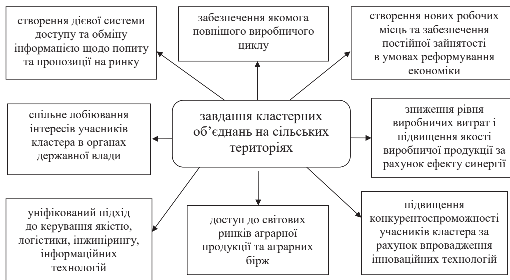
Рис. 2. Основні завдання кластерних об'єднань на сільських територіях

– низькі взаємозв'язки науково-дослідних установ і виробників (підприємства часто не є замовниками і споживачами інноваційно-наукового продукту);