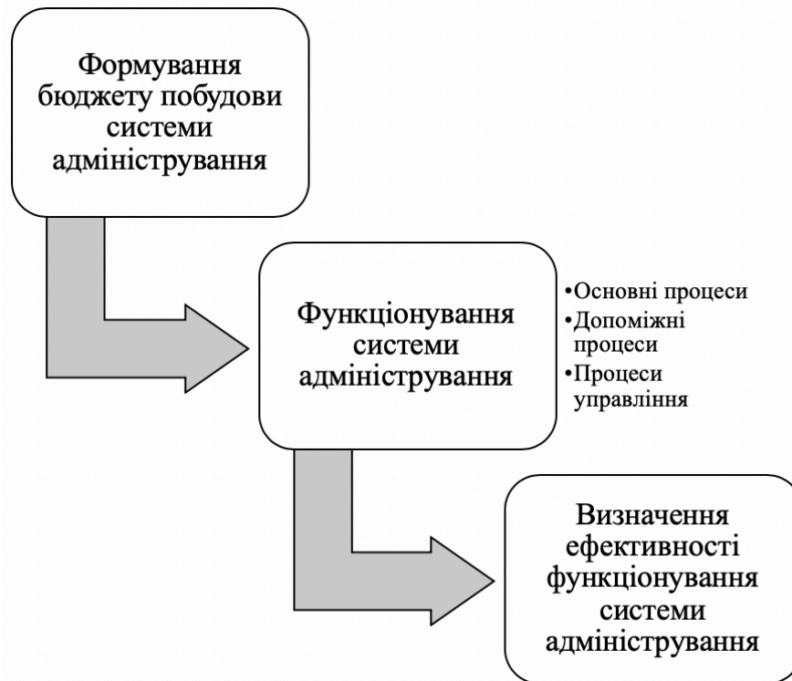
Рис. 2 Модель економічного обґрунтування побудови систем адміністрування

C_{ру} – витрати на реалізацію процесів управління у системах адміністрування.