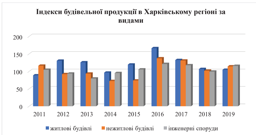
Рис. 4. Динаміка зміни індексів будівельної продукції в Харківському регіоні за видами в період 2011 – 2019 рр.

високий позитивний зв'язок названих величин (коефіцієнт кореляції 0,94). Отже, залучення населення до інвестування будівництва власного житла позитивно впливає на розвиток галузі в цілому.