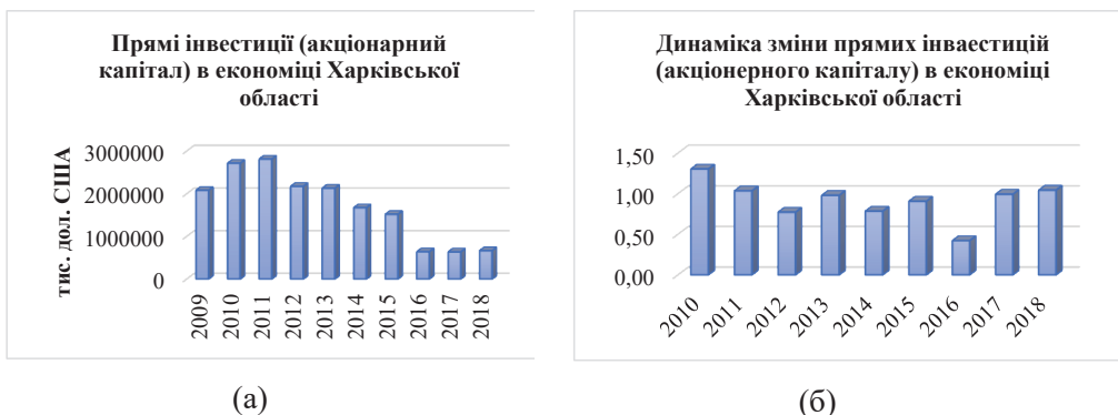
Рис. 1. Величина (а) та динаміка зміни (б) прямих інвестицій (акціонерного капіталу) в економіці Харківського регіону