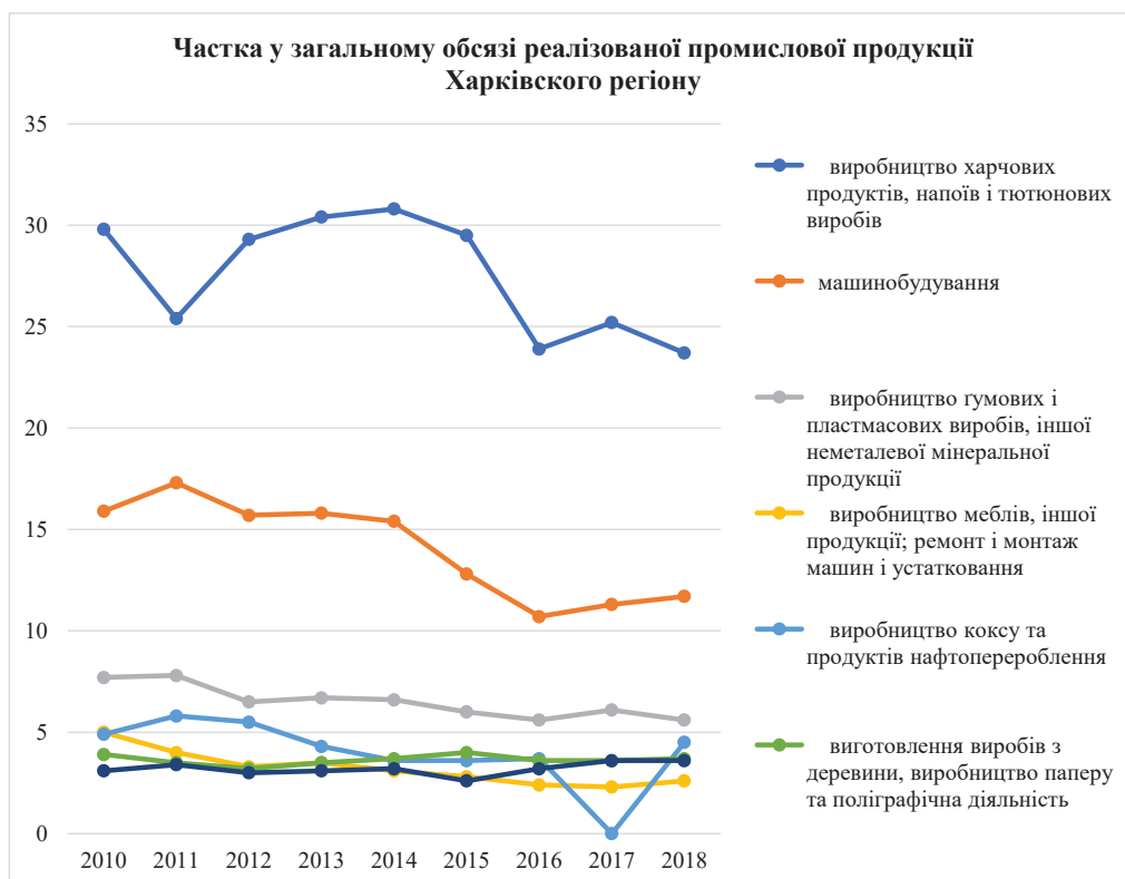
Рис. 2. Динаміка зміни частки найважливіших напрямків переробної промисловості в загальному обсязі реалізованої промислової продукції Харківського регіону

Автором було проведено детальний аналіз структури та результатів діяльності провідних галузей економіки Харківського регіону: промисловості, сільського господарства, будівництва та торгівлі.