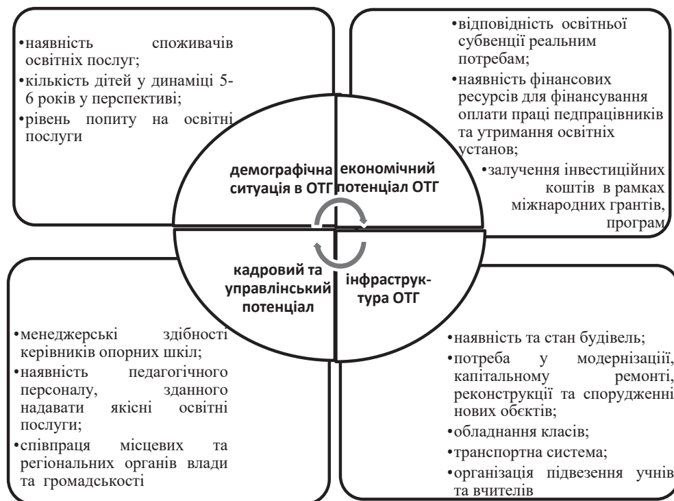
Рис. 3. Фактори впливу на формування спроможної освітньої мережі ОТГ