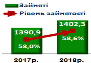
Рис. 2. Рівень зайнятості [8]

Разом з цим виникає безробіття в Дніпровському регіоні. А безробіття викликає бідність у мешканців