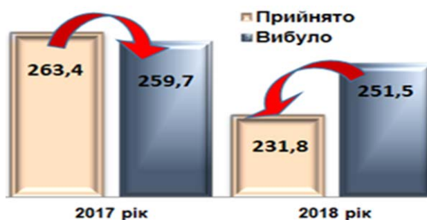
Рис. 5. Кількість прийнятих та звільнених працівників [8]

Також за інформацією наданою інспекцією з питань праці та зайнятості населення Дніпровської міської ради, у місті Дніпро протягом тривалого часу спостерігається складна демографічна ситуація. Чисельність наявного населення у Дніпропетровській області, за оцінкою, на 1 березня 2019 р. становила 3200909 осіб. Упродовж січня–лютого 2019 р. чисельність населення