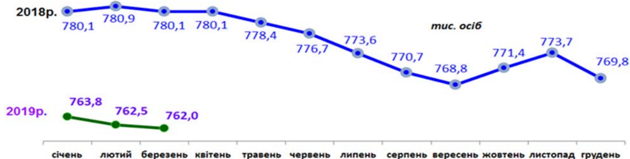
Рис. 4. Середньо-облікова кількість штатних працівників [8]

міста. Бідність гальмує усе – розвиток підприємництва, інновації та соціальну сферу.