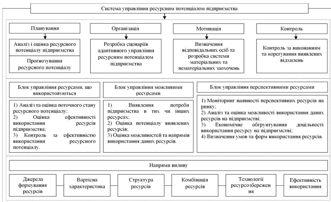
Рис. 2. Модель управління ресурсним потенціалом підприємства