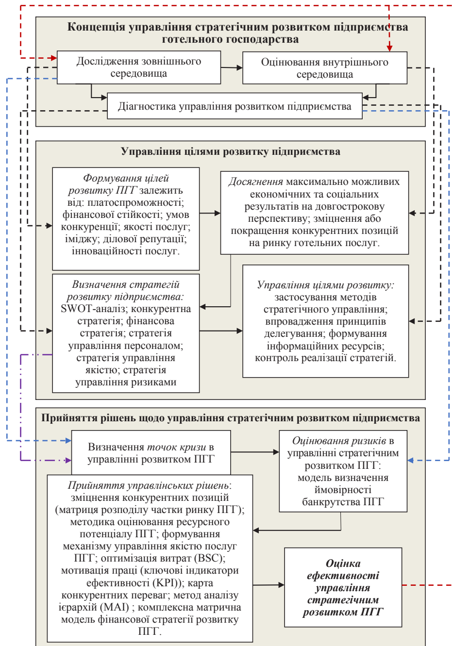
Рис. 2. Структурна модель науково-методологічного підходу до концепції управління стратегічним розвитком підприємства