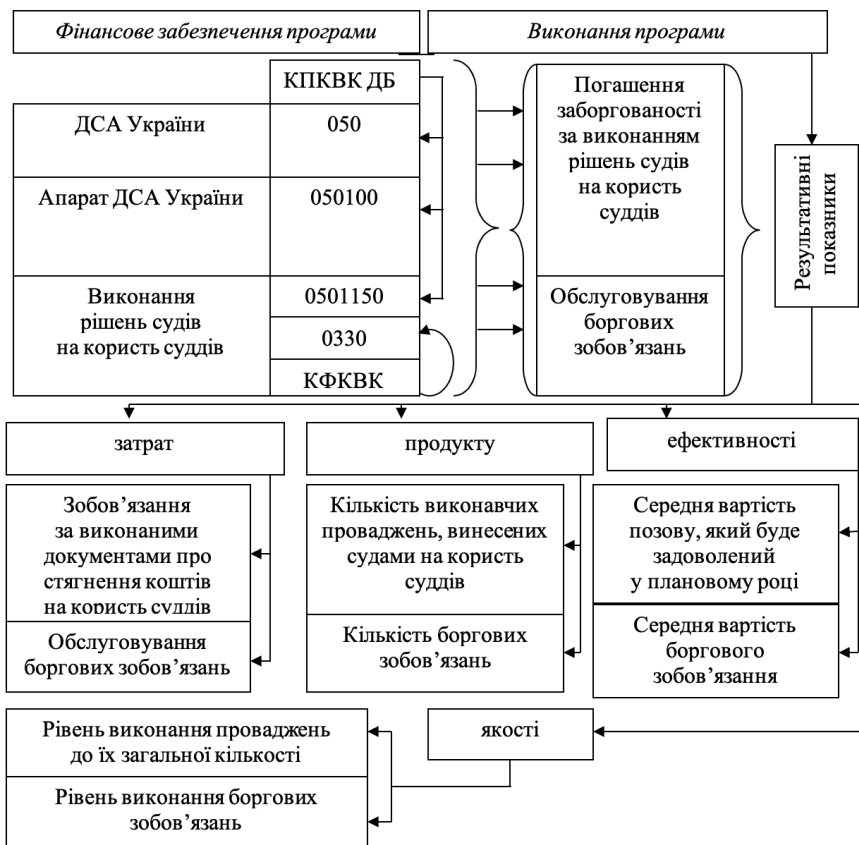
Рис. 1. Складові та результати здійснення видатків за бюджетною програмою 0501150 «Виконання рішень судів винесених на користь суддів»

Для забезпечення безспірного списання коштів державного бюджету в Держказначействі відкривають в установленому порядку відповідний рахунок. Перерахування коштів стягувачу здійснює Держказначейство у тримісячний строк із дня надходження відповідних документів і відомостей. Казначейство веде бухгалтерський облік, складає звітність про здійснення в установленому порядку безспірного списання коштів державного бюджету. Держказначейство здійснює списання коштів за бюджетною програмою 0501150 «Виконання рішень судів на користь суддів» за такими кодами економічної класифікації: 22730 «Інші виплати населенню» та 2800 «Інші поточні видатки» (рис. 1) [7].