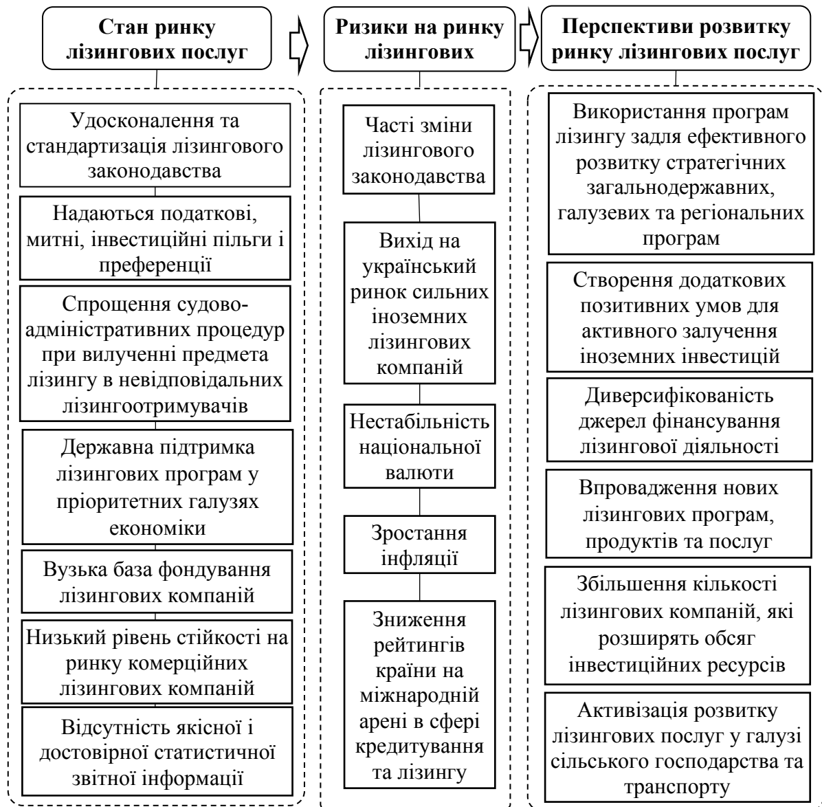
Рис.3. Аналіз напрямів розвитку ринку лізингових послуг в контексті трансформації фінансових відносин в Україні

додаткові позитивні умови для активного залучення іноземних інвестицій. Саме це вирішить питання про нездатність багатьох підприємств України проводити реконструкцію та модернізацію виробництва за допомогою лізингу.