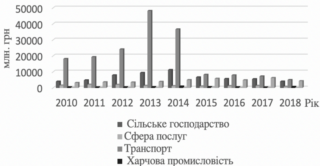
Рис. 2. Розподіл вартості чинних договорів фінансового лізингу за галузями, 2010-2018 рр., млн. грн

Джерело: складено на основі: [7, 12, 13, 14, 15, 16].