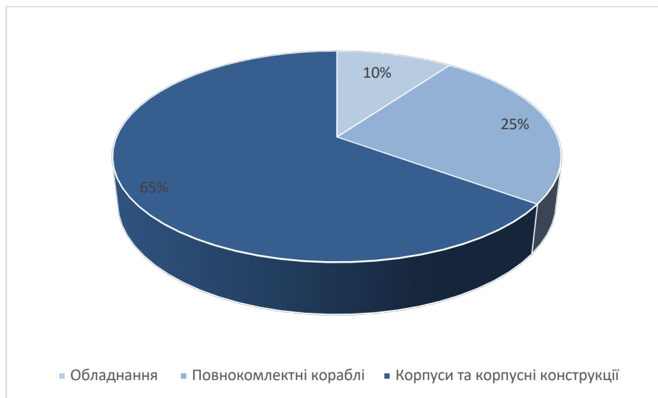
Рис. 2. Структура виробництва суден в Україні Джерело [9]

вистачало грошових коштів, світова економічна криза і, як було зазначено вище, нестабільна політична ситуація в країні – це ключові фактори, які гальмують розвиток української суднобудівельної галузі. Починаючи з 2010 року та до сьогодні в структурі виробництва суден в Україні, займають корпуси і корпусні деталі, тобто металомісткі конструкції з низькою доданою вартістю та практично повною відсутністю наукових досліджень (рис. 2) [9].