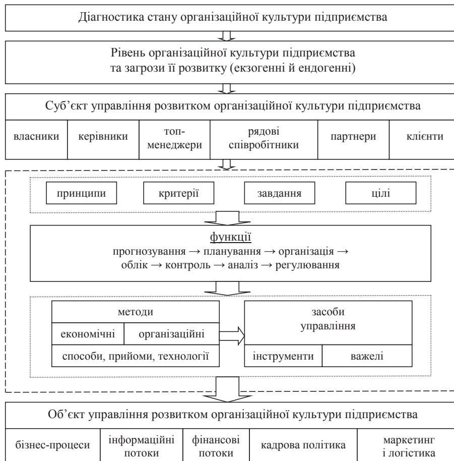
Рис. 3. Структурні складові організаційно-економічного механізму управління розвитком організаційної культури підприємства