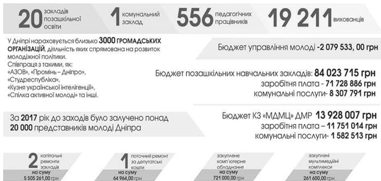
Рис. 2. Звіт за рік стосовно відкритих можливостей для молоді в умовах децентралізації.

- Вчитель року – рейтингово-конкурсна програма для вчителів. У 2017 році більше 30 осіб отримали грошові премії.