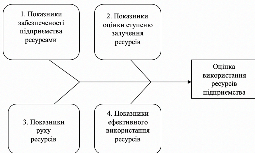
Рис. 2 Система показників оцінки ефективності виробництва

Розглядаючи методики оцінки ефективності виробництва, запропоновано інтегрований підхід, який окреслить кількісні та якісні параметри. Групи показників оцінки використання ресурсів показано на рис. 2.