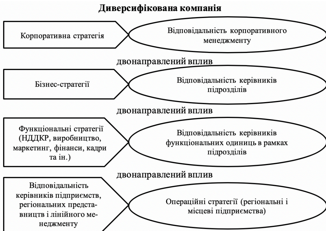
Рис. 1. Етапи розробки корпоративної стратегії диверсифікованої та бізнес стратегії однопрофільної компанії

Корпоративна стратегія - це загальний план управління диверсифікованою компанією, що описує дії по досягненню певних позицій в різних галузях і підходи до управління окремими видами діяльності. На рис. 1 представлені основні елементи стратегії диверсифікованої компанії. У корпоративній стратегії повинні бути відображені чотири найважливіші напрямки.