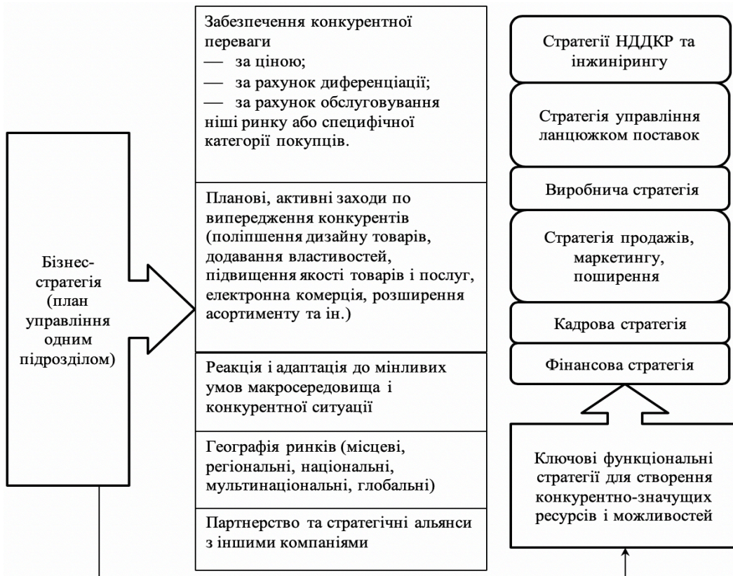
Рис. 3. Створення стратегії для однопрофільних компаній

Бізнес-стратегія містить наступні елементи.