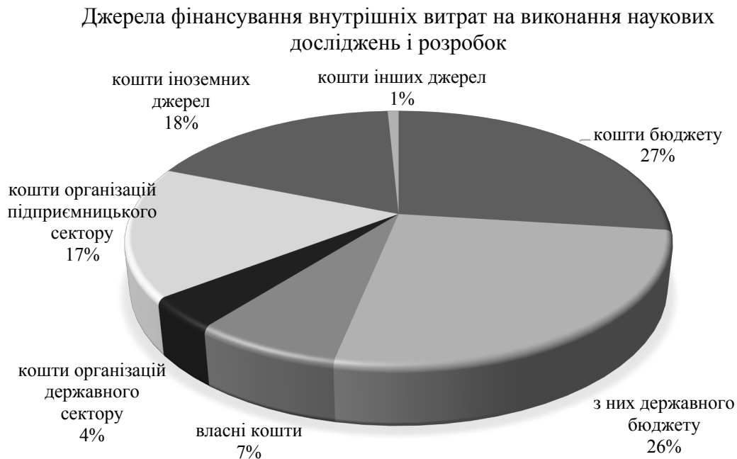
Рисунок 2. – Розподіл загального обсягу витрат на дослідження у 2017 році, %

Розподіл загального обсягу витрат на здійснення наукових досліджень та розробок за джерелами фінансування у 2017 році зображено на рис. 2.