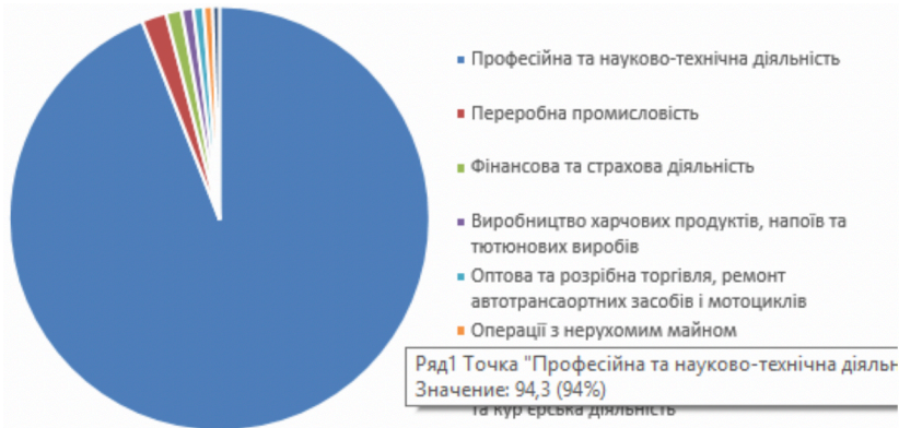
Рис.1 Прямі інвестиції (акціонерний капітал) з України за видами економічної діяльності у 2017 році, у % до загального підсумку, (окрім тимчасово окупованих територій Донецької та Луганської області та АРК)