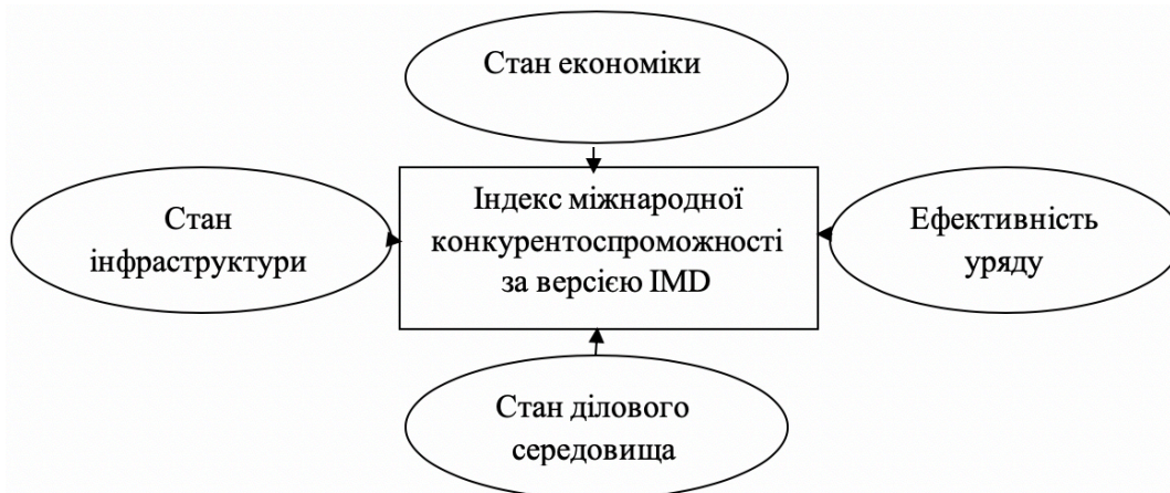
Рис. 2. Складові індексу міжнародної конкурентоспроможності за версією Institute of Management Development

дослідженням, оцінюється на основі думки аналітиків, опитувань керівників великих корпорацій і фахівців в галузі управління. Підсумкове рейтингування здійснюється на основі зворотного співвідношення: дві третини - статистичні дані і одна третина - експертні оцінки [3].