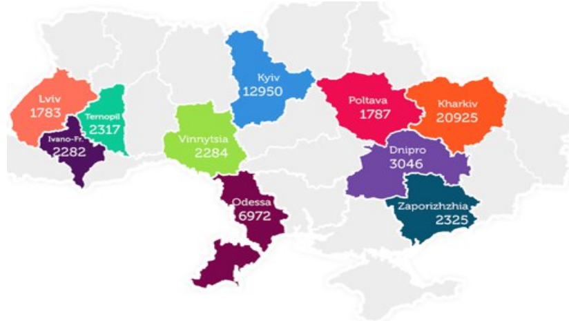
Рис.3 Распределение численности иностранных студентов по областям Украины на 01.01.2016. Составлено авторами на основе данных: [6].

Иностранные студенты учатся преимущественно в ВУЗах Харькова, Киева, Одессы, Днепра, Запорожья, Винницы, Львова (рис.3).