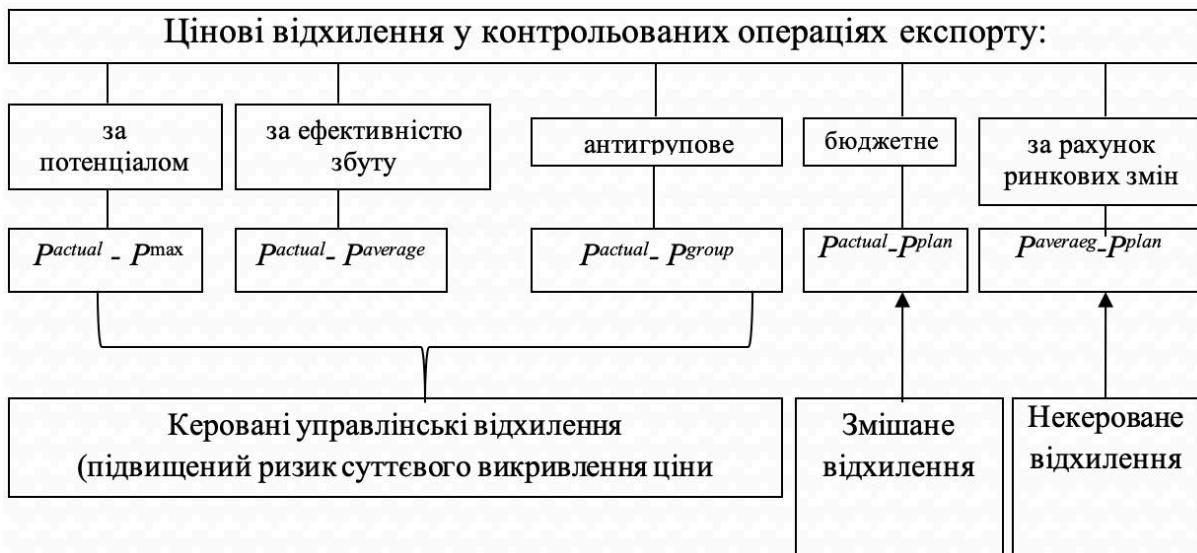
Рис. 3. Система цінових відхилень у контрольованих операціях експорту

Як видно з рисунку, цінові відхилення у контрольованих операціях експорту можна розподілити на ті, які підпадають під ризик суттєвого викривлення, або керовані управлінські відхилення, та ті, які не характеризуються ймовірністю викривлення, – некеровані.