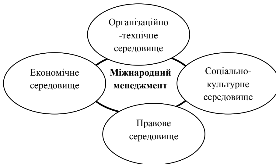
Рис. 2. Середовище міжнародного менеджменту

Характерні риси міжнародного менеджменту мають економічний, соціально-психологічний, правовий і організаційно-технічний аспекти. Перші два є комбінуванням складових саме управління, яка була розглянута нами вище. Виокремлення середовища міжнародного маркетингу зображено на Рис.2.