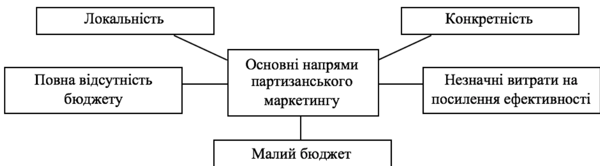
Рис. 1. – Напрями партизанського маркетингу

Серед методів партизанського маркетингу можна виділити кілька напрямків (рис.1):