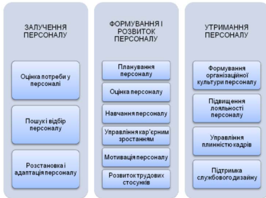
Рис. 3. Напрями кадрового забезпечення діяльності підприємств в умовах міжнародної економічної діяльності

за компетенціями, знаннями та навичками та встановлення відповідності якостей персоналу компанії розробленим моделям компетенцій.