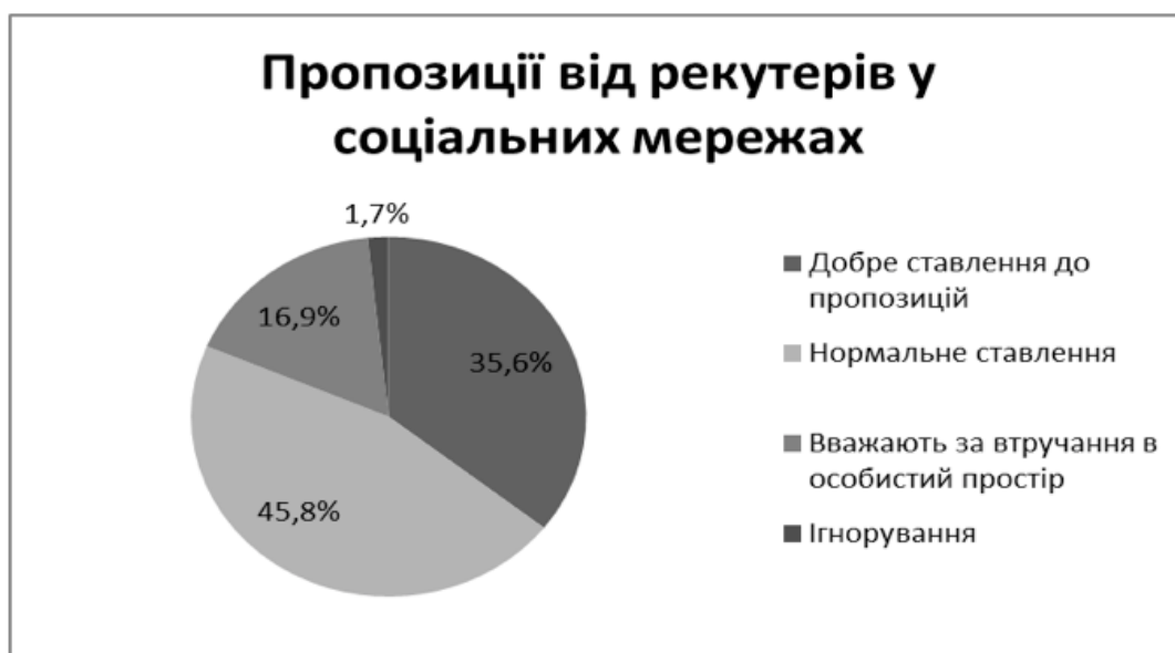
Рис. 3. Розподіл опитуваних за реакцією на пропозиції вакансій від рекрутерів

Загалом, 45,8% опитаних вважають нормальним отримувати пропозиції по роботі від рекрутерів у соціальних мережах (рис.3).