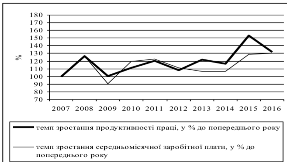
Рис. 3. Динаміка темпів зростання середньомісячної заробітної плати і темпів зростання продуктивності праці на підприємствах галузі у 2007-2016 рр.

На підприємствах галузі України продуктивність праці зростала більш високими темпами, ніж середньомісячна заробітна плата, у 2009, 2013, 2014, 2015 роках, зворотні процеси спостерігались у 2008, 2010, 2011, 2012 і 2016 роках.