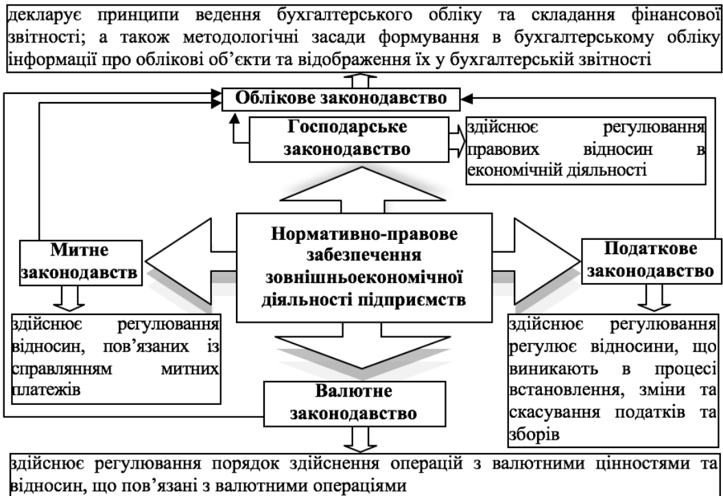
Рис. 1 Система нормативно-правового забезпечення зовнішньоекономічної діяльності підприємств

Основи ведення зовнішньоекономічної діяльності визначено в Законі України «Про зовнішньоекономічну діяльність», який є загальним нормативно-правовим документом, що регулює ряд питань, пов'язаних зі здійсненням господарських операцій підприємствами на закордонних ринках товарів і послуг, капіталу тощо. Положення даного закону окреслюють види та суб'єктів, принципи здійснення та правила регулювання зовнішньоекономічної діяльності, а також особливості укладання зовнішньоекономічних договорів (контрактів) та правила оподаткування і принципи митного регулювання діяльності суб'єктів господарювання. Крім того, розкриваються такі питання, як ведення розрахунків та кредитування суб'єктів зовнішньоекономічної діяльності, страхування і ліцензування, відповідальність та порядок розгляду спорів при здійсненні зовнішньоекономічних операцій.