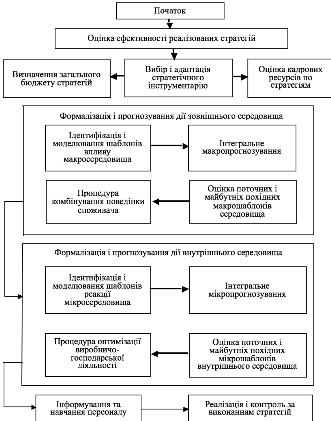
Рис. 4 Структурно-логічна модель удосконалення процесу стратегічного управління

ступеня формалізації, специфіки, ефективності та інструментальної бази.