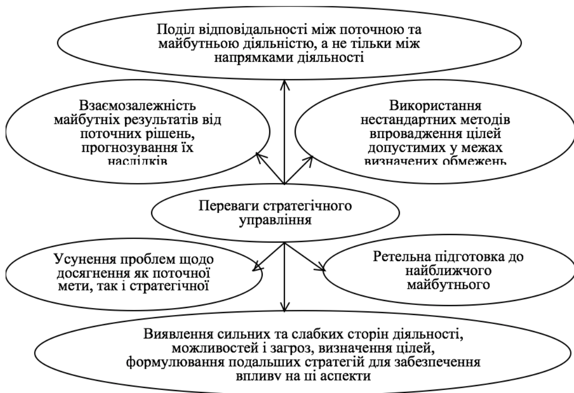
Рис. 3 Визначальні переваги стратегічного управління на підприємстві

розвитку та координації усіх виробничо-господарських процесів. Формування стратегії дає можливість сформулювати напрями та способи досягнення поставлених цілей. Але навіть у випадку впровадження комплексу необхідних умов для їх реалізації, можуть виникати певні труднощі та проблеми, які є наслідками, що можуть призвести до кризового стану підприємства. Врахування визначених обмежень та вирішення поставлених проблем, пов'язаних з необхідністю розвитку будь-якого підприємства, розробка та впровадження методологічних основ стратегічного управління підприємства є вимогою певного проміжку часу.