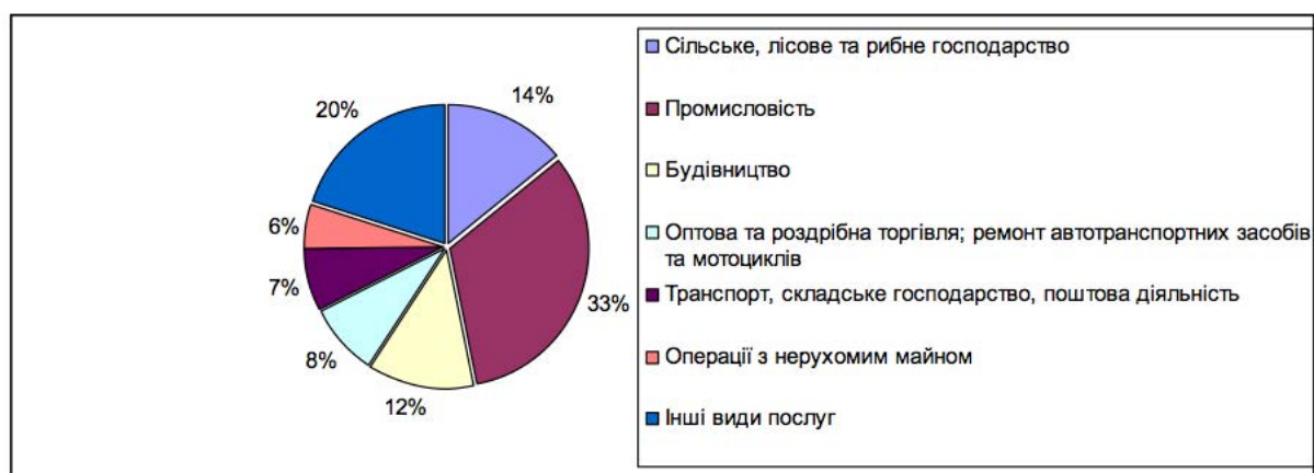
Рис. 1. Структура капітальних інвестицій за видами економічної діяльності у 2016 р.

Аналізуючи структуру капітальних інвестицій за видами економічної діяльності у 2016 р. бачимо, що найбільша їх частка припадає на промисловість – 32,8%. З них: 17,3% – припадає на переробну промисловість; 6,3% – займають інвестиції в добувну промисловість і розроблення кар'єрів; 8,6% – вкладено в постачання електроенергії, газу, пари та кондиційованого повітря; 0,6% – займають інвестиції в водопостачання; каналізацію, поводження з відходами (рис. 1).