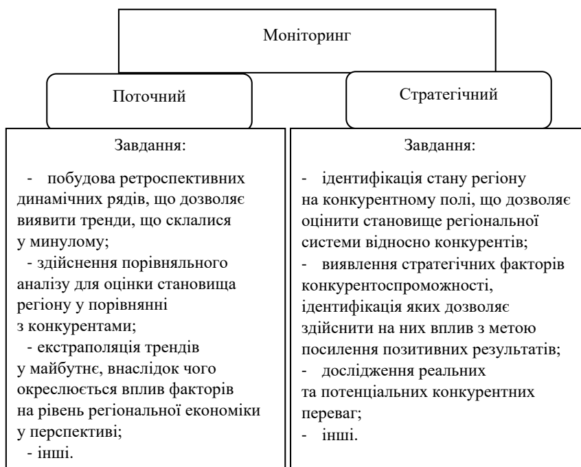
Рис. 1. Напрями моніторингу та їх завдання

Моніторинг поточного стану базується на широкому спектрі індикаторів, серед яких доцільно обрати найбільш інформаційні. Так, оцінка рівня людського