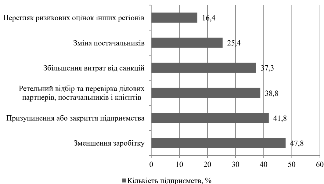
Рис. 2. Вплив війни в Україні на японські компанії, %

Проводячи паралель із вітчизняними підприємствами, можемо побачити, що протягом останніх років, особливо в період пандемії та повномасштабної війни держава намагалась всіма доступними методами підтримати бізнес. Серед найбільш дієвих механізмів підтримки підприємств виділяють податкові послаблення у вигляді скасування штрафних санкцій, надання звільнення від сплати ряду податків,