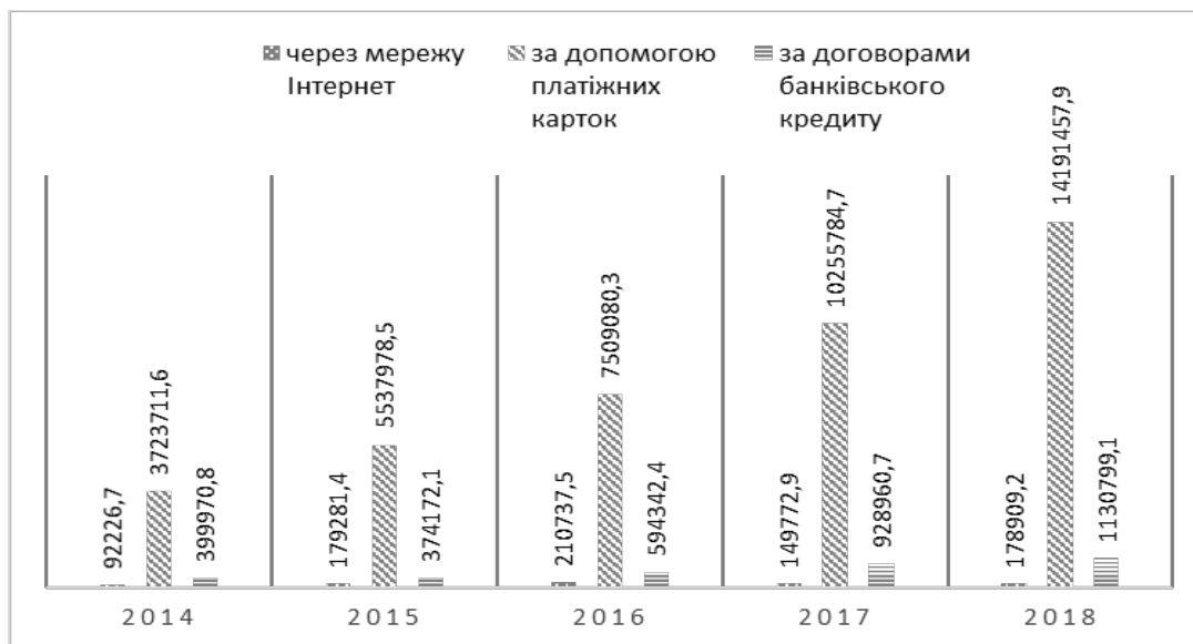
Рис. 3 Структура роздрібного товарообороту підприємств (тис. грн.)

2014 року і становить 1130799,1 тис. грн. Такі умови надають споживачам можливість швидко, зручно і з мінімальними витратами часу здійснювати придбання необхідних товарів в необхідній кількості в умовах вільного вибору і широкого асортименту. Процес вдосконалення системи послуг необхідний для забезпечення комфорту споживачів та спрощення процесу роздрібною реалізації, що в свою чергу призводить до збільшення обсягу товарообігу.