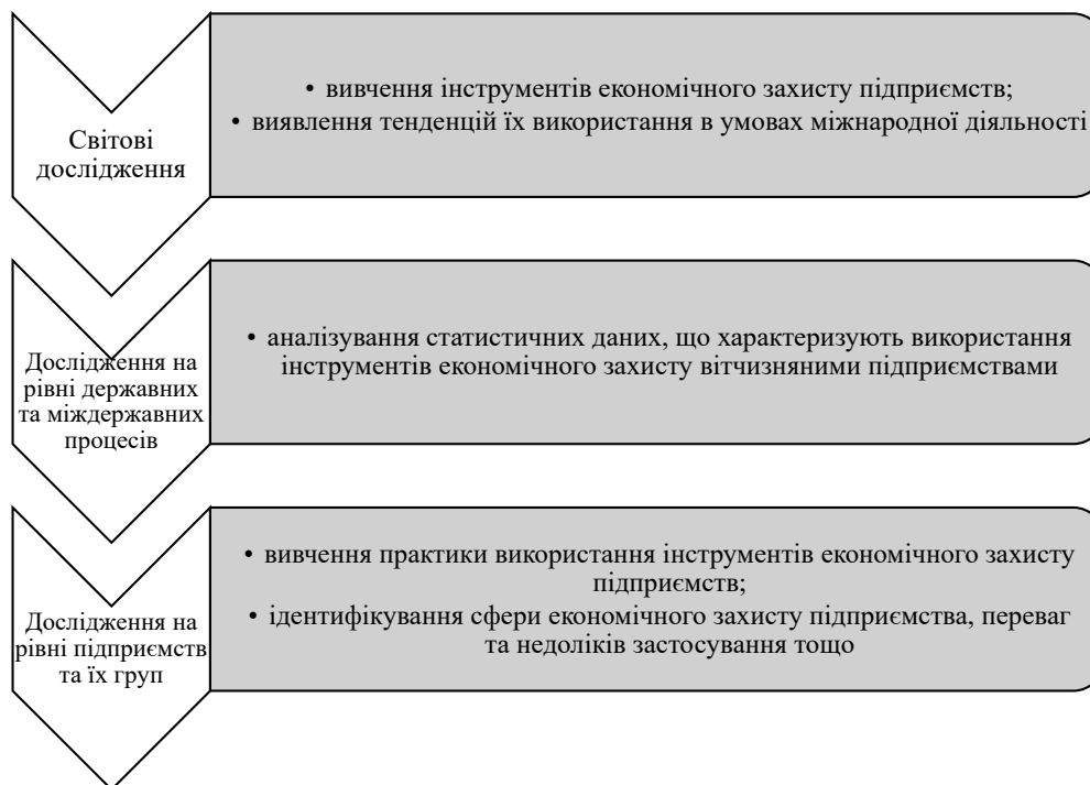
Рис. 1. Рекомендована послідовність вивчення стану використання інструментів економічного захисту підприємств в умовах міжнародної діяльності

Виділення невирішених раніше частин загальної проблеми. Не зважаючи на значну кількість наукових публікацій, присвячених вивченню окресленої проблематики, питання використання інструментів економічного захисту підприємств залишається не достатньо дослідженим в умовах міжнародної діяльності. Зокрема, ретельного аналізування потребують