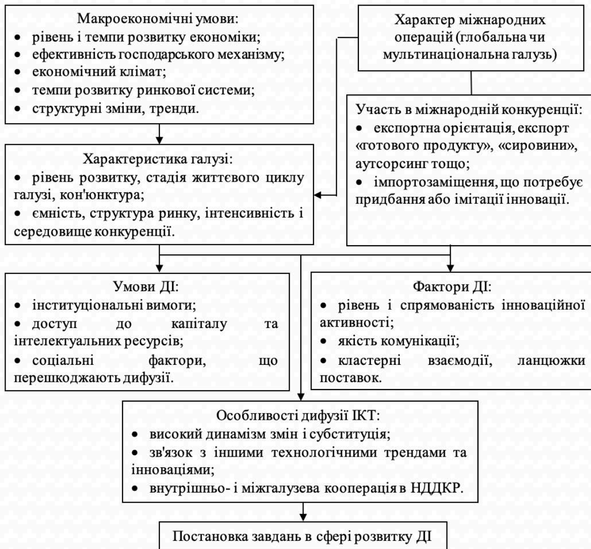
Рис. 2 Схема врахування особливостей дифузії ІКТ в галузях, де вони використовуються

як сукупність інституціональних, економічних, організаційних, соціокультурних умов розглядається на рівні сектора ІКТ і галузей, де вони використовуються. Це включає врахування доступу до інвестиційного капіталу, інноваційної інфраструктури, рівня підтримки стартапів і малого та середнього бізнесу, соціальних факторів;