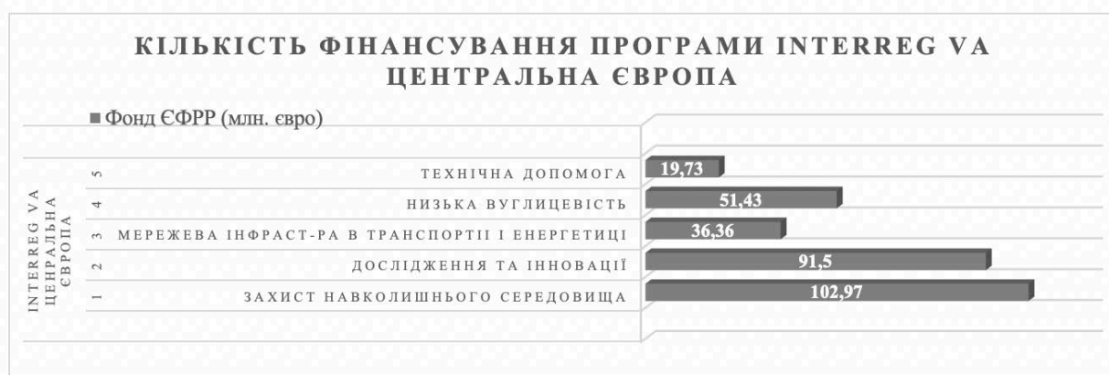
Рис.4 Кількість фінансування програми Interreg VA Центральна Європа на період 2014-2020 рр.

Задля аналізу ефективності програм у втіленні в життя цілей сталого розвитку, проглянемо показники СР, у вибраних країнах-нових членах ЄС які класифіковані за 17 цілями стратегії, які носять комплексний і неподільний характер і забезпечують збалансованість всіх трьох компонентів сталого розвитку: економічного, соціального та екологічного (табл.2,3) та згрупуємо їх за результатами шляхом кластерного аналізу (рис.5 ) [9,10].