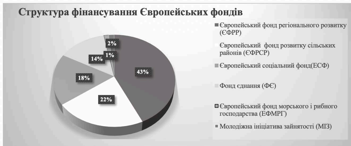
Рис. 2 Діаграма структури фінансування європейських фондів

стихийні лиха, є вираженням європейської солідарності з постраждалими від лих регіонами Європи. На сьогоднішній день підтримка була надана 24 різних європейських країн на суму понад 5 мільярдів євро [4]. У таблиці 1 розглянемо структуру фінансування європейських фондів десяти обраних нами для дослідження країн взагалі та окремо Європейським Союзом, користуючись рис.3.