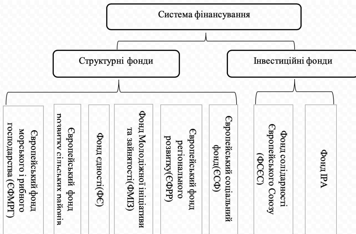
Рис.1 Структура багаторівневої системи фінансування

Забезпечується зайнятість також і серед молодого населення, залучаючи його до інноваційних проектів розвитку, що фінансово підтримуються Фондом Молодіжної ініціативи та зайнятості (ФМІЗ) . За рахунок Фонду єдності (ФЄ) фінансуються проекти розвитку транспортної інфраструктури та екологічні проекти.