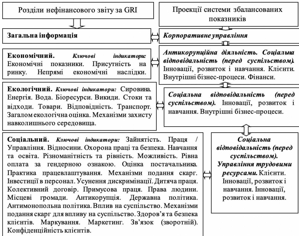
Рис. 4 Узгодження синергії ключових індикаторів діяльності державних підприємств

нефінансових звітів. Методичний підхід, за якого досягається синергія між нефінансовим звітом (за GRI) та проекціями системи збалансованих показників (вимірювання та оцінки ефективності діяльності за суттєвими аспектами), подана схематично на рисунку 4.