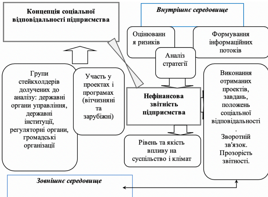
Рис. 1 Модель управління соціальною відповідальністю державних підприємств (загальна концепція)

відповідальністю державних підприємств, яка визначає наповнення звітів нефінансовими показниками представлена на рис. 1