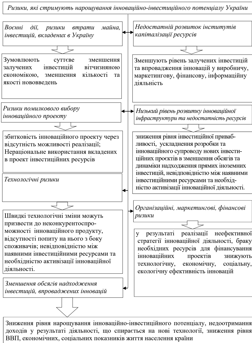
Рис. 3. Проблеми та ризики, що стримують нарощування інноваційно-інвестиційного потенціалу України