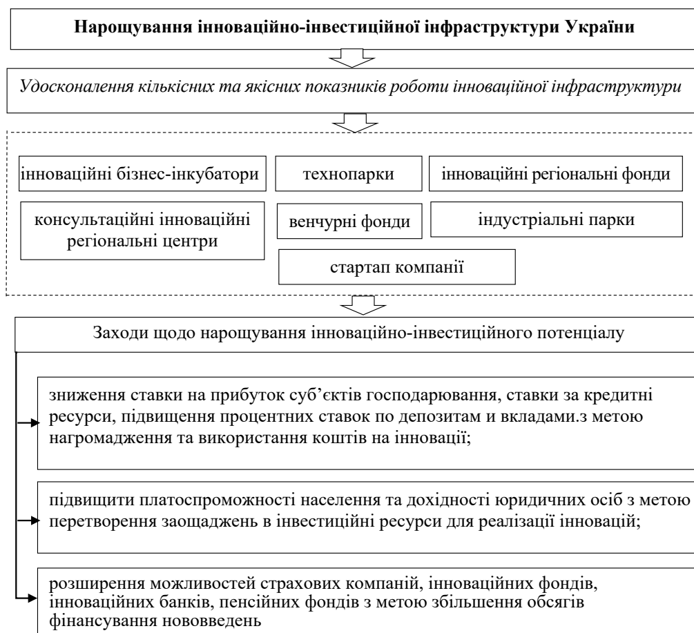
Рис. 4. Заходи нарощування інноваційно-інвестиційного потенціалу