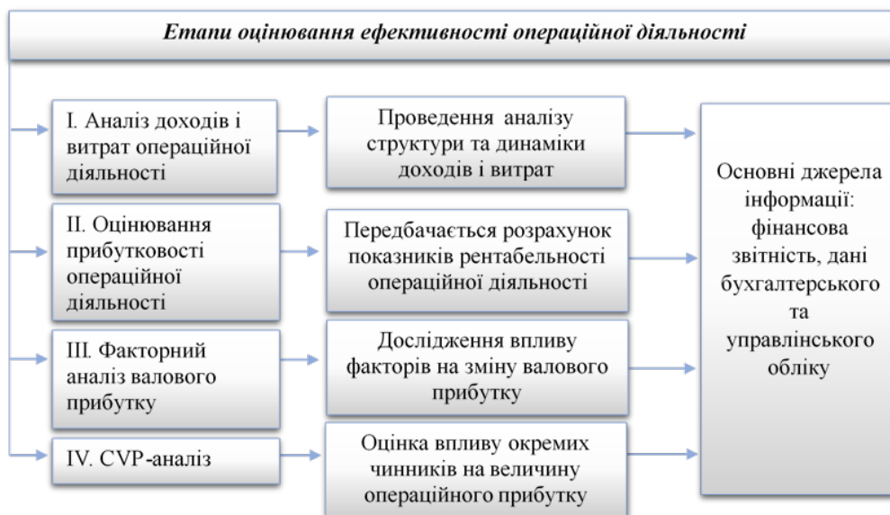
Рис. 1. Етапи оцінювання операційної діяльності підприємства