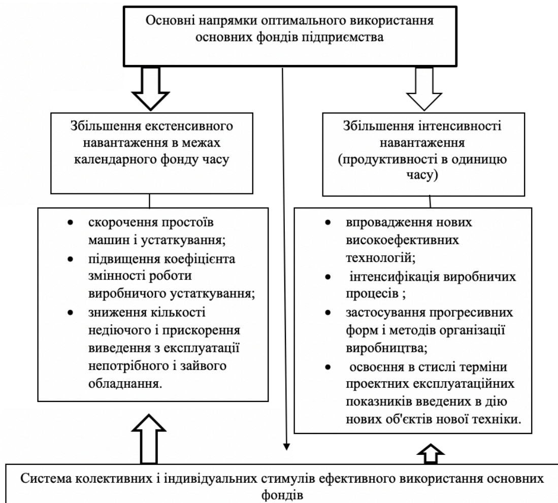
Рис. 2 Модель забезпечення ефективного використання основних фондів підприємства Джерело: [6]

Заходи, наведені на рис. 2, можна умовно розділити на дві групи 1) збільшення екстенсивного завантаження; 2) підвищення інтенсивного навантаження. При цьому потрібно звернути увагу на дві важливі обставини: по - перше, якщо екстенсивне завантаження машин і устаткування обмежується тільки календарним фондом часу, то можливості підвищення інтенсивного навантаження обладнання, його продуктивність не є обмеженими. По- друге, здійснення заходів екстенсивного напрямку, як правило, не вимагає капітальних витрат, а збільшення рівня інтенсивного використання виробничого апарату пов'язане зі значними інвестиціями.