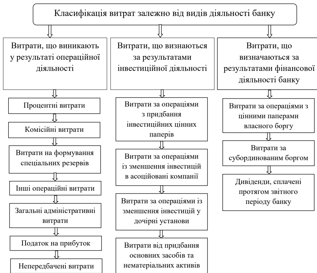
Рис. 1. Класифікація витрат залежно від видів діяльності банку

Як бачимо, за період аналізу відбулось зменшення процентних витрат за всіма статтями. Так, найбільше зменшення спостерігається за процентами за коштами банків – у 2021 році тільки за 9 місяців на 76,44% у порівнянні з минулим роком.