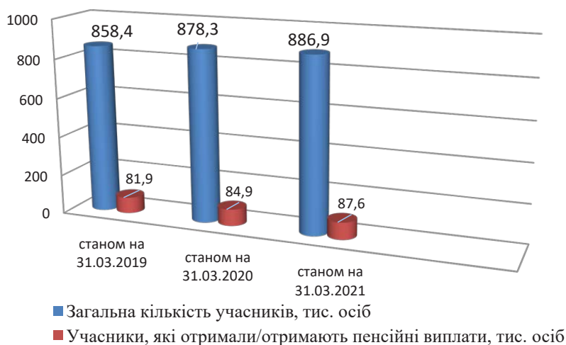
Рис. 5. Динаміка чисельності учасників НПФ