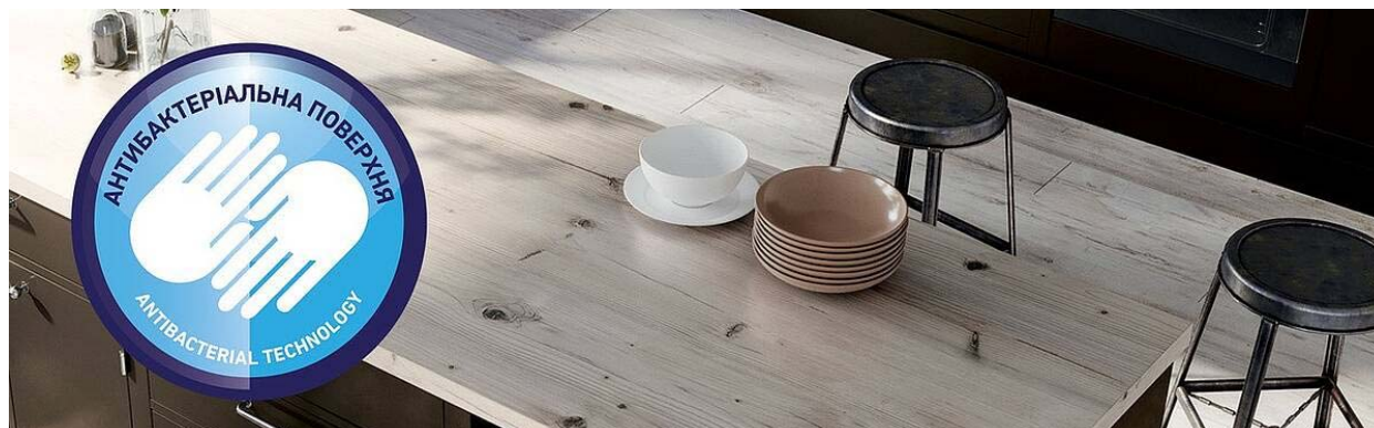
Рис. 1. Стільниці з антибактеріальним покриттям від “Swiss Krono”

Щодо експорту, то Україна займає лише 38 рядок серед світових експортерів меблів (рис. 2) [5]. Щоб увійти у десятку найкращих меблевих виробників, вітчизняним виробникам потрібне семиразове зростання меблевого експорту.