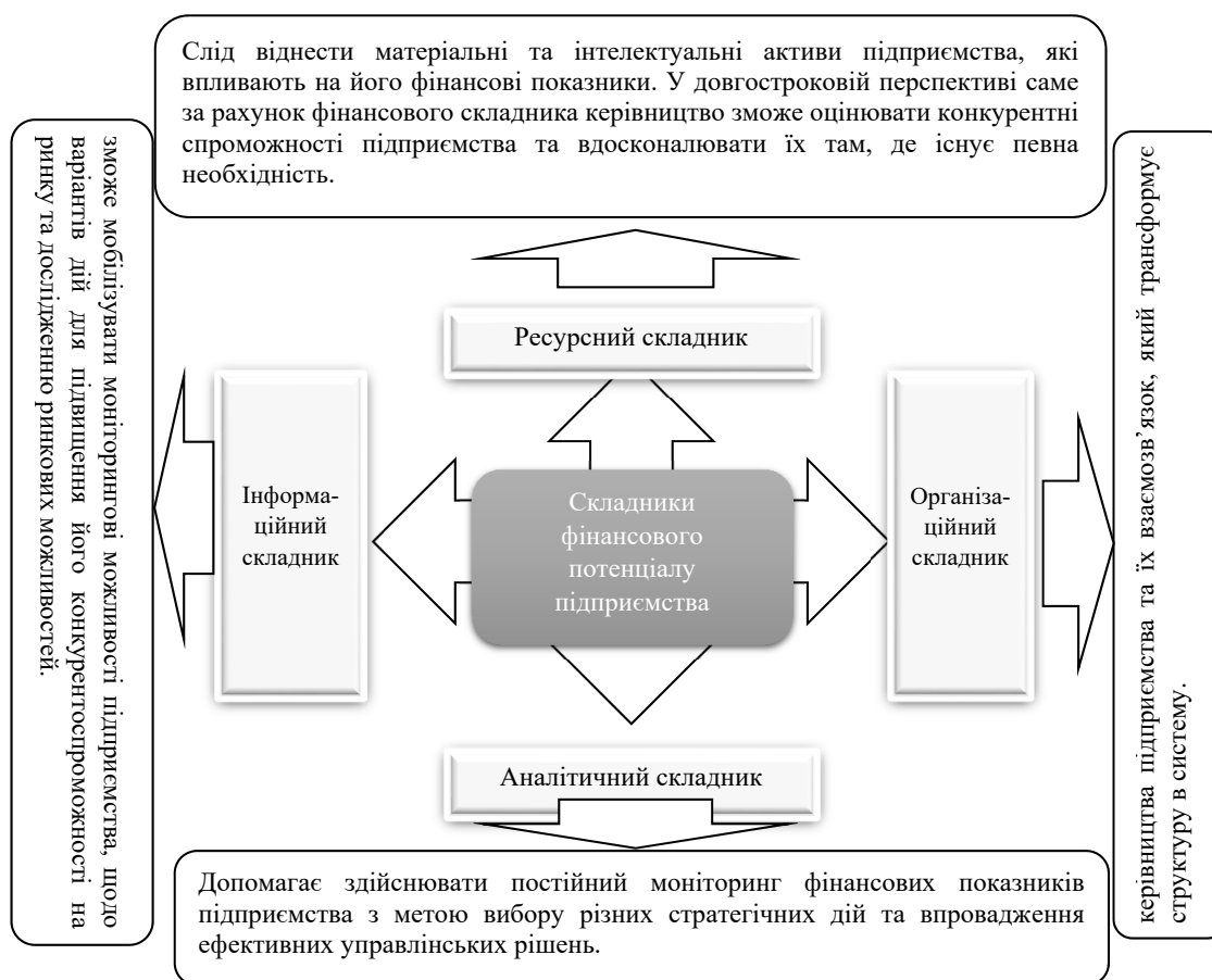
Рис. 2. Елементи фінансового потенціалу підприємства