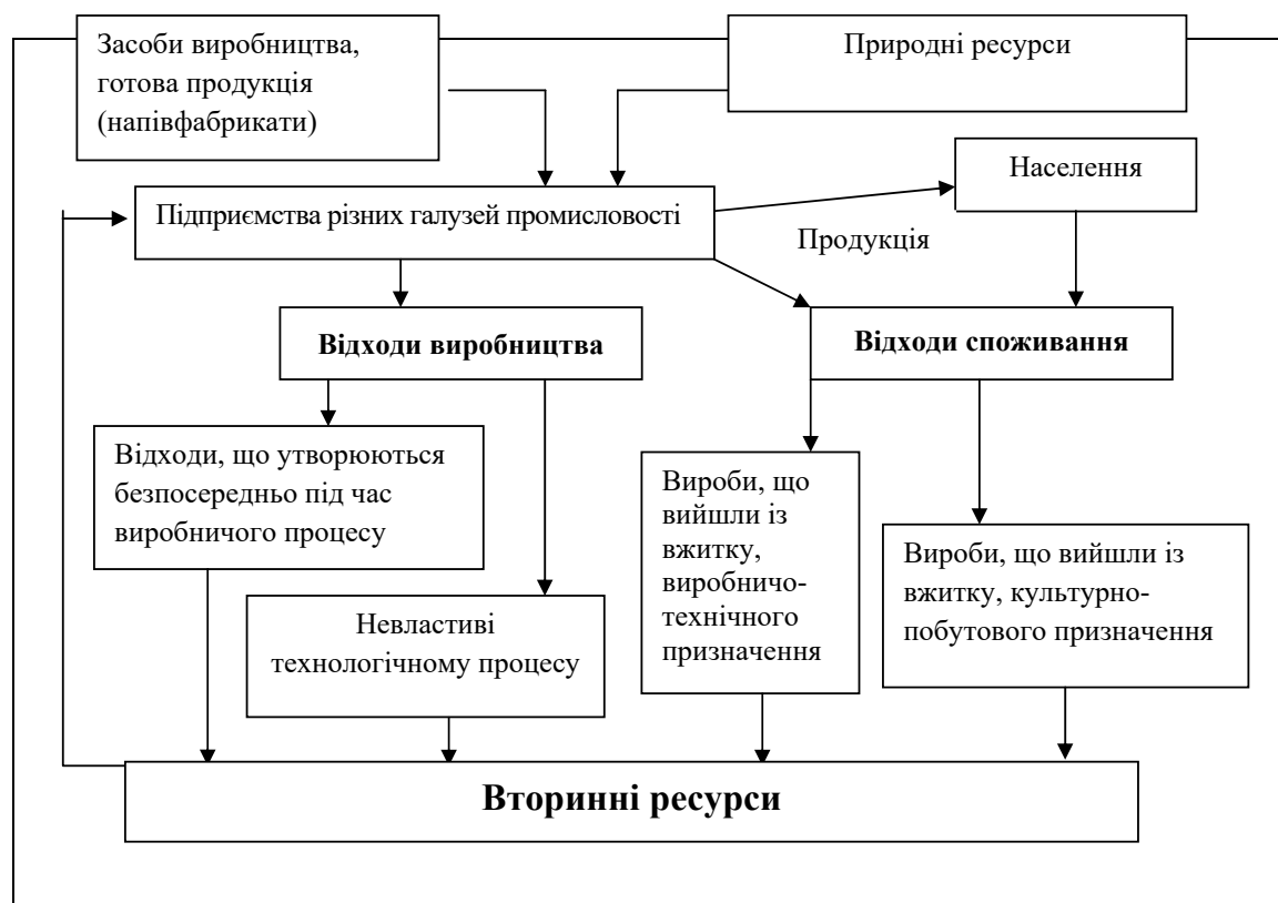
Рис. 2. Джерела утворення вторинних ресурсів