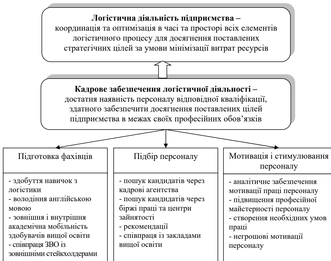
Рис. 2. Складники кадрового забезпечення логістичної діяльності