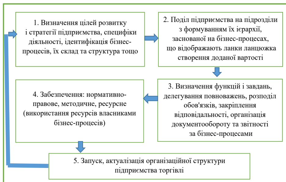
Рис. 2. Концептуальна схема формування організаційної структури підприємства торгівлі з урахуванням процесного підходу

2) укладання договорів на забезпечення безпеки з державними та/або недержавними органами, що надають послуги із забезпечення безпеки (інтегрована служба);