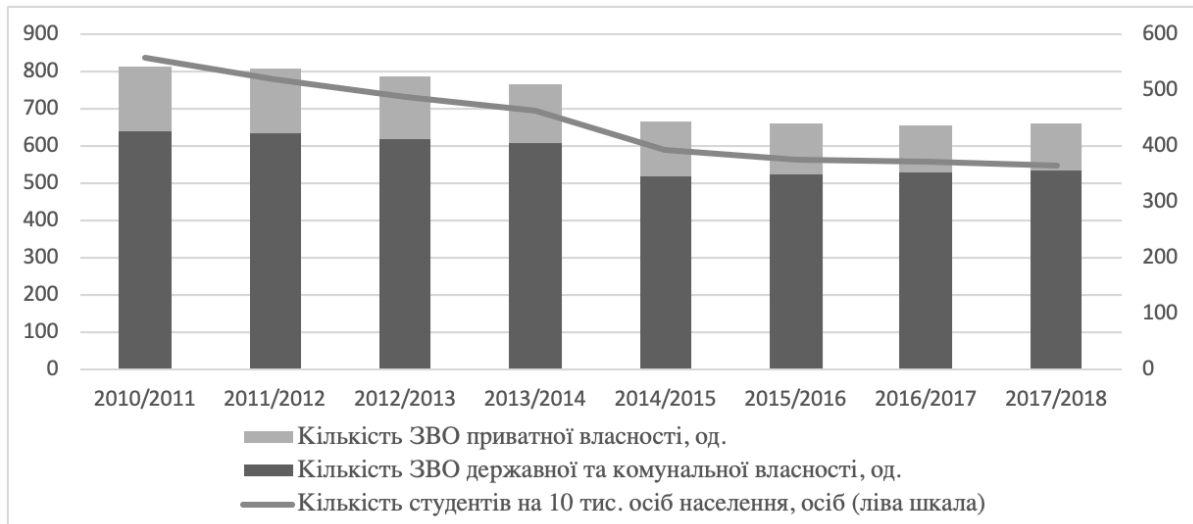
Рис. 1. Показники кількості ЗВО України у 2010-2017 рр.

Виклад основного матеріалу. Як свідчать показники ЗВО України у 2010-2017 рр., їх кількість кожен рік скорочується, проте зменшується також і кількість студентів у існуючому населенні, що може свідчити не тільки про негативні тенденції демографічного скорочення, а й про низьку мотивацію молоді до здобуття вищої освіти (рис. 1).