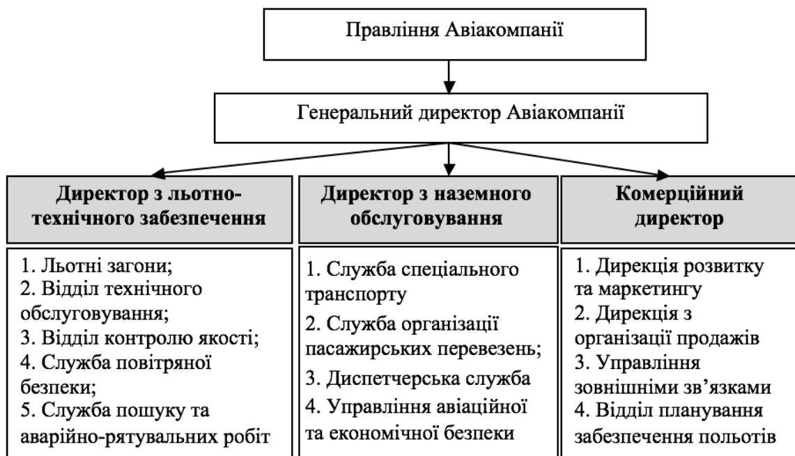
Рис. 2. Піраміда відповідальності у авіакомпанії «Українські Середземноморські Авіалінії» Складено автором

Згідно з фрагментом сфер відповідальності авіакомпанії «Українські Серед-земноморські Авіалінії», представленим на рис. 2, керівник льотного загону відповідає лише за витрати, пов'язані зі здійсненням польоту, натомість директор з льотно-технічного забезпечення польотів контролює не лише прямі витрати на здійснення польотів, але й накладні витрати пов'язані з утриманням відділів контролю якості, технічного обслуговування та авіаційно-рятувальних робіт. У свою чергу генеральний директор Авіакомпанії, поряд з витратами отриманими в льотно-технічному комплексі та комплексі з наземного обслуговування, контролює ще й доходи, що утворилися в комерційному комплексі.