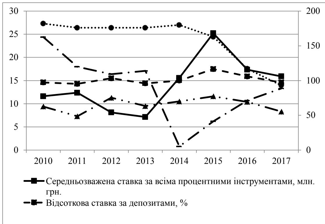
Рис. 1 Динаміка зміни показників функціонування банківського сектору в Україні за період 2010-2017 років Джерело: [9]

платоспроможних банків зменшилася майже на 50% (93 у 2017 році у порівнянні із 182 у 2010), середньозважена ставка за всіма процентними інструментами з 2012 року зросла в двічі (16% у порівнянні з 8,13%), аналогічна нестабільна ситуація спостерігається і за рештою показників функціонування банківського сектору в країні, основні з яких наведені на рисунку 1.